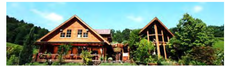
カントリーカフェ「ハーブクラブ」

目覚め、潜在能力を高めることでした。そのため、『杣ノ川ランド』やグリーンフェスタなどのイベントを開催し、沢山の方々に来てもらいました。この10月27日開催の『杣ノ川ランド』は第28回になります。」