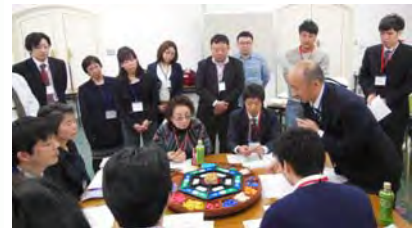
ルールの説明を聞くのも真剣

二日目は「経営計画シート」の記入から始まりました。前期の実績を振り返り、当期の具体的方針・対策を立て、計画P/Lを作成します。それにあたり、損益分岐点を使った「戦略会計」の解説があり、「固定費を賄える粗利を稼がないと採算は取れない」ということを理解しました。では、どの商品を