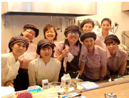
「クラムボン」で働く利用者・職員の皆様

「また、利用者の社会での適応能力を高めるために外出訓練に取り組みました。例えば、NTTに協力してもらい、重度の子の服にGPSを取り付け、電車に乗って自由に外出させたんですね。もちろん、親も我々も同行せずに。我々はハラハラしながら、GPSで行方を追っていると、どんどん電車を乗りついで、ついに『なばなの里』(三重県桑名市)まで行ったのですね。実はなばなの里は、今度みんなで旅行に行こうと言っていたところでした、その子の心中は行きたくてしょうがなかったのでしょうかね。お金があり、行動が