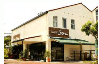
デリカテッセン イーハートブ「SORA」

「そのように考えるようになったのは、ある手紙がきっかけでした。たまたま、うちのハーブクラブに来られたお客さんで生きる希望を失いかけていた方がいらっしゃいました。ハーブクラブでは、障害を持っていても生き生きと働いている利用者の姿を見て、まだまだ頑張れる自分を発見されました。苦しんでいるのは障害を持っている人だけではない。障害者が逆に健常者の支えになれる。宗教家みたいなことを言いますが、神は障害者を必要でない存在として作ったのではなくて、彼らは存在する必然性、使命があったのだと思うようになったんですね。」