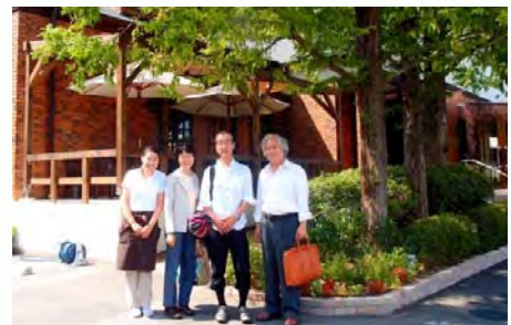
カフェバーカー「クラムボン」

「青葉仁会は『幸福の平等』を理念に出発し、最初の目標は、『自由に暮らす権利の保障』でした。開設当初、うちの利用者の方は重度の人ばかりでしたが、月額給料3,000円が目標でした。一日一本ジュースが買える金額です。自分で稼いだお金を自販機に入れて、どれを買うか迷う。親が選ぶのではなく、自分で選択できる環境を作る。それが『自由に暮らす権利の保障』でした。当時はまだ保護の時代でした。時代が変わり、今は『ワークフェア』、つまり、就労することで福祉の実現を図ることが世界の流れです。当時、私らはまだそんな思想は意識していませんでした。ただ、貧困が成長を妨げている。正常な社会のルートに乗せることによって、本人たちは潜在能力を発揮していく。そう考えていました。」